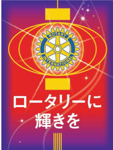
2014～2015年度のRIテーマ 「ロータリーに輝きを」(Light Up Rotary) R.I会長/ゲイリーC.K.ホァン

2014～2015年度 第2740地区スローガン 『地域に輝くロータリー』 ガバナー 宮崎清彰